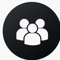
График работы производства